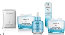
H 2 O INFUSION