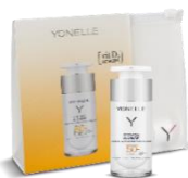
ANTI-AGE D 3 CREAM SPF 50+